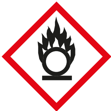
Líquidos y sólidos oxidantes