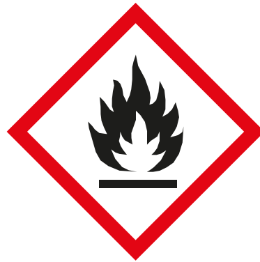
Gases, líquidos y aerosoles inflamables